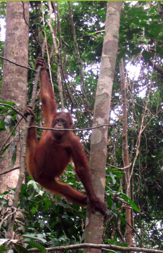
Andere Tiere wie dieser Orang Utan in Tabin profitieren schon bald von den ersten Früchten unserer gepflanzten Bäume