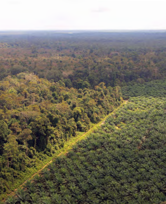
Vorerst geretteter Wald nahe unsers Nordkorridors