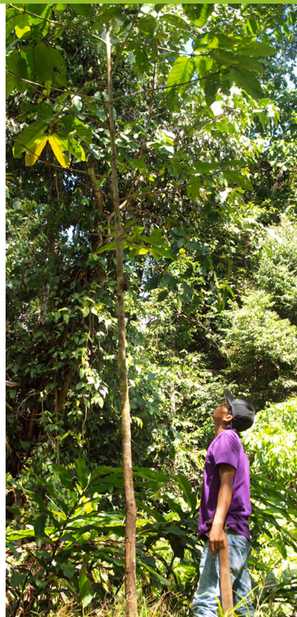
Arbeiter mit 2011 gepflanztem Baum

Andere Tiere wie dieser Orang Utan in Tabin profitieren schon bald von den ersten Früchten unserer gepflanzten Bäume.